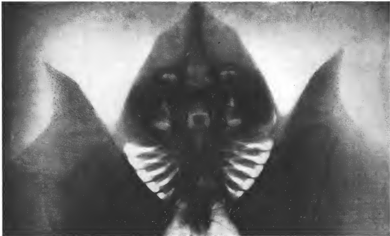
FIG. 1. — Raia clavata , exemplaire anormal.